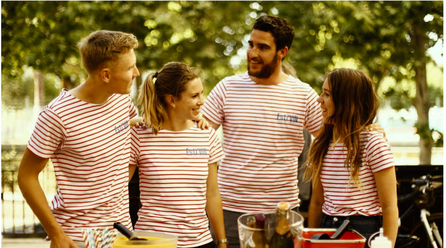
Evènement Esti'vin organisé par les étudiants